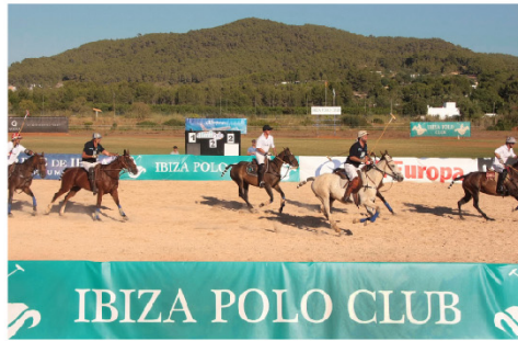
polo y estilo 13

Ibiza es un destino que invita a los turistas a disfrutar y en un lugar como éste, qué mejor que poder jugar unos chikers.