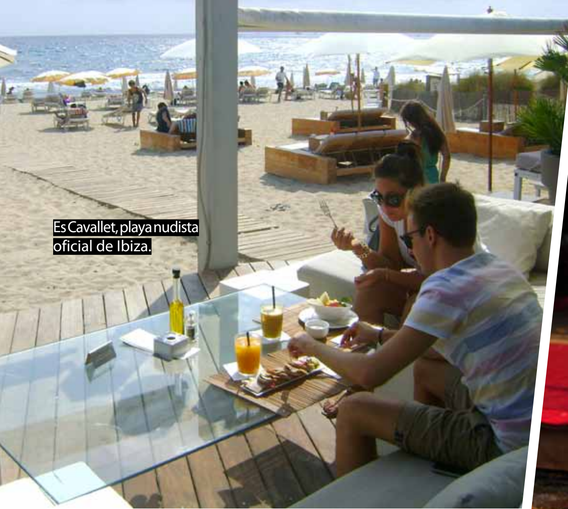
Es Cavallet, playa nudista oficial de Ibiza.

Es Cavallet es la playa nudista oficial. Tiene dunas de arena y verdes montículos. Hay un "Chiringuito" famoso por ser un imán para celebridades del mundo del deporte, de la moda y la farándula. Y otro que se llama "Chiringay", punto de encuentro del turismo gay internacional. El nudismo se practica con naturalidad, discreción y elegancia, aquí y en otras calas (playas) a las que sólo se puede llegar por mar. Aguas verde esmeralda, cristalinas, ideales para bucear, tranquilas y limpias.