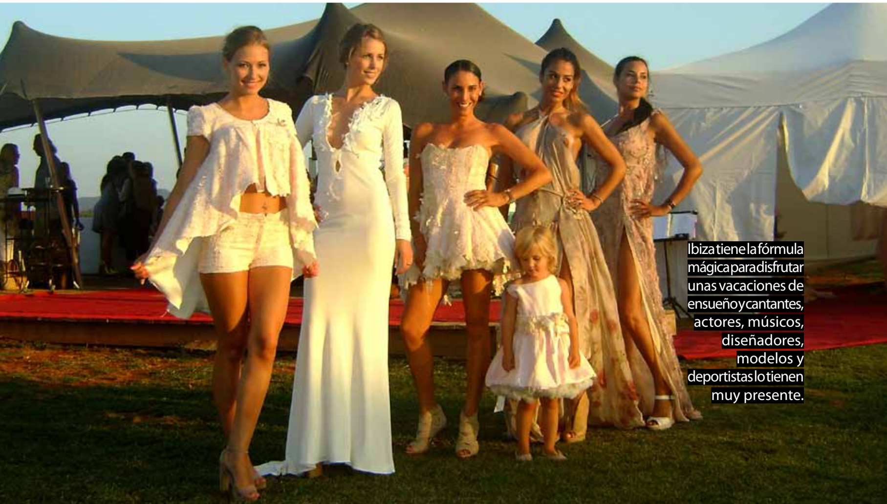
Ibiza tiene la fórmula mágica para disfrutar unas vacaciones de ensueño y cantantes, actores, músicos, diseñadores, modelos y deportistas lo tienen muy presente.