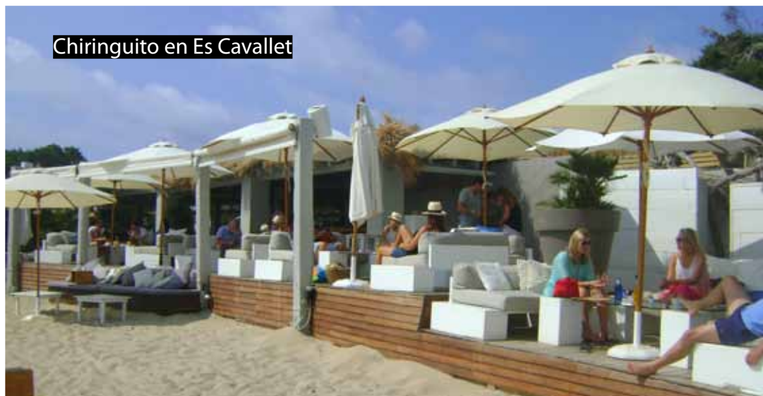
Chiringuito en Es Cavallet

La puesta de sol nos anuncia que entramos a una nueva dimensión. En "Ibiza town", los restaurantes sacan sus mesas a la calle, las velitas parpadean, los camareros dispuestos. Después de la ducha, y de cambiarse de ropa, todo el mundo parece distinto. Las callecitas ahora con luz artificial parecen más misteriosas, las chicas con maquillaje y tacones, aun más guapas. Las boutiques y sus deslumbrantes escaparates, los restaurantes y sus langostas vivas tras el cristal, todo parece ahora más psicodélico, más erótico, con las luces palpitantes y las músicas que se mezclan en el aire.