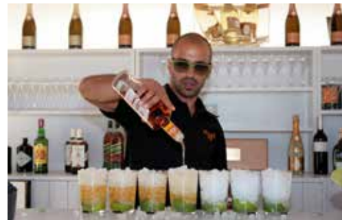
CLUB HOUSE BAR