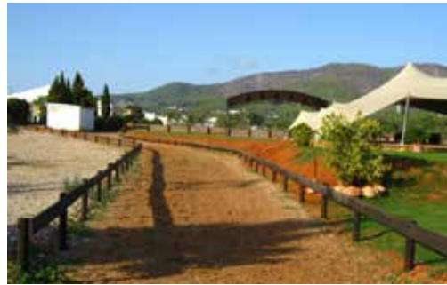
HORSE TRACK TO PADDOCKS