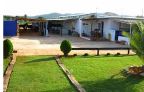
STABLES FROM CLUB HOUSE