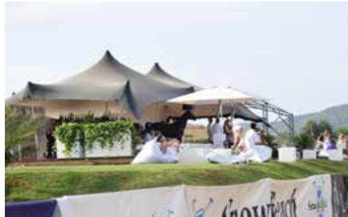
CLUB HOUSE VIP TENT