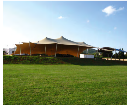
INSTALACIONES DE IBIZA POLO CLUB.