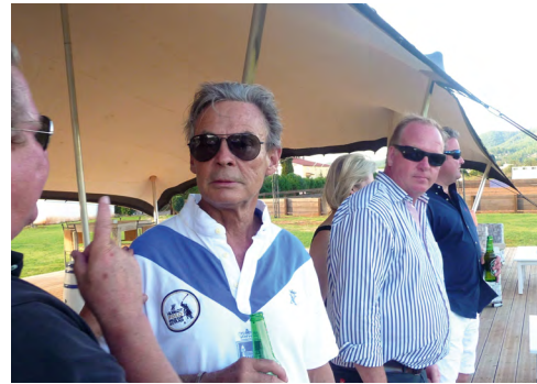
PIERO ODILIER PRESIDENTE DE LA FEDERACIÓN EUROPEA.